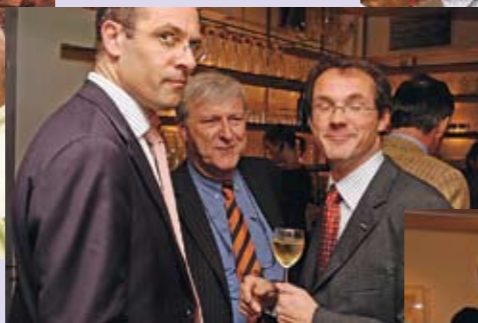
Even bijpraten hoe 't was en wegzwimelen bij wat het wordt